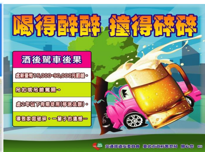
圖 2: 酒駕防制標語: 喝得醉醉、撞得碎碎