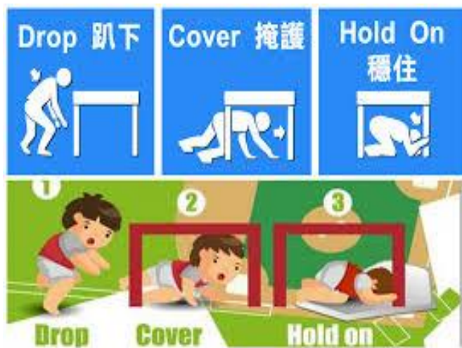
圖 1: 教室內遇地震避難掩護動作

為防制新興毒品進入校園危害學子身心健康，台北市政府教育局特提撥甲基安非他命及 K 他命毒品尿液快篩試劑供家長領用(10 份)，若有相關需求可洽本室春暉承辦人申請；另提供新興毒品樣式供各家長參考(如圖 3)